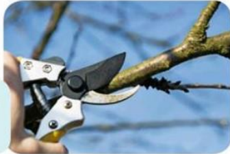
tijeras de podar

Algunas máquinas necesitan energía humana .